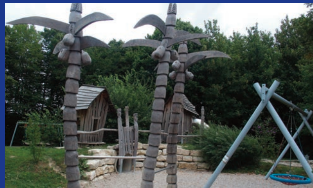
Dieter Kugler Erster Bürgermeister